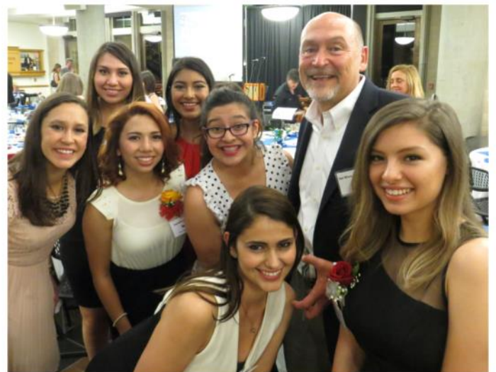
Las imágenes son mejor que las palabras, porque los colores de nuestra diversidad son el color de un gran país llamado hogar