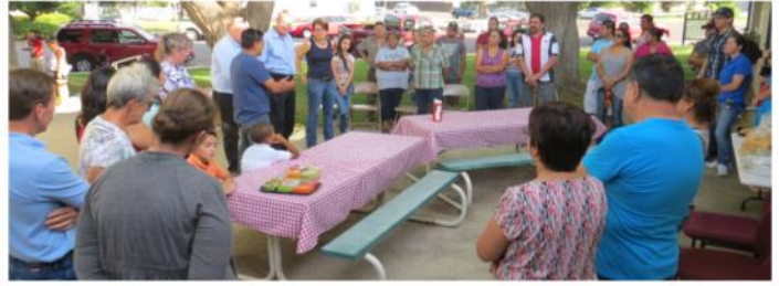
Foto abajo: Entrenamiento sobre organización en Montrose con el apoyo de WCC y WORC

El desarrollo del liderazgo y nuestra participación como un movimiento por la justicia y la igualdad es parte fundamental del trabajo de HAP.