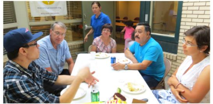
Arriba: Miembros del Comité de Montrose durante una convivencia con representantes de la ciudad, el Departamento de Policía y la organización Live Well el pasado 29 de Julio.