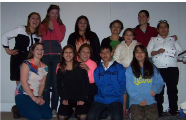
Foto: Miembros de la comunidad de Telluride durante la Semana Nacional para los Derechos de las Víctimas con apoyo del Centro de Recursos del Condado de San Miguel y el 7th Distrito Judicial de Colorado.