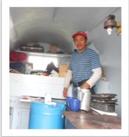
Abajo: el eje central de un campito de hierro, en uso desde 1956