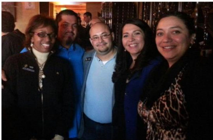
Foto izquierda: durante el Colorado Latino Fórum junto con congresistas campeones de leyes pro-inmigrantes

“Mi motivación para ayudar a otros es mi propia familia. Nosotros hemos conocido el miedo por un sistema de inmigración obsoleto que puede destruir la unidad familiar en cualquier momento”.